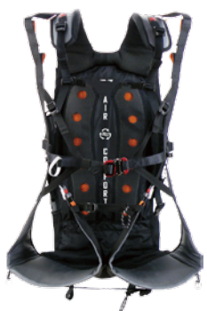
Split legs (標準)