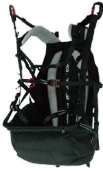
SLT PM +¥1,000 (税込 ¥1,100)