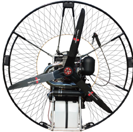
4分割シングルケージ