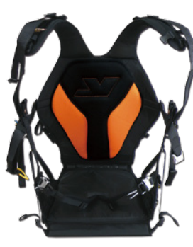
Universal +¥3,000 (税込 ¥3,300)

フライトに欠かせないハーネスは、APCO 社製軽量ハーネスの Split legs、SLT、オーソックスなタイプの Universal の 3 種類からご希望のハーネスを選択してください。