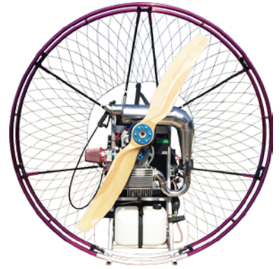
SMタイプ6分割ダブルケージ

新デザインのアルミフレームはアルミ素材を変更し、ケージ下部を一体化することにより、外圧が掛かった場合でも均等に圧力を分散することにより急激なケージの変形が出ない設計となっています。フェザーシリーズは標準でダブルケージかシングルケージ、及びサイズを選択できます。また、ラインナップに無い SM タイプもアルマイト加工を施されたニューフェザーダブルケージをご用意しております。