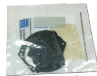
■フルボロ WB32/37 メタルセット ¥2,800 (税込 ¥3,080)