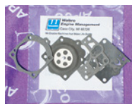
■フルボロ WG 用 ¥1,800 (税込 ¥1,980)