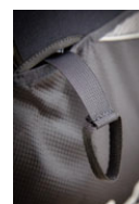
レスキューアジャスト