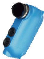
■ノイズボックス Solo/Raket ¥10,700 (税込 ¥11,770)