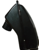
■ノイズボックス Solo/mini2 ¥13,000 (税込 ¥14,300)