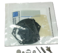
■フルボロ WB32/37 メタルセット ¥2,800 (税込 ¥3,080)