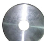
汎用 (特大) ¥6,000 (税込 ¥6,600)