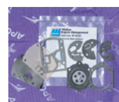
■フルボロ WB32/37 ¥2,000 (税込 ¥2,200)