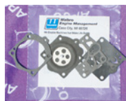
■フルボロ WG 用 ¥1,800 (税込 ¥1,980)