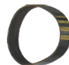
■mini2リダクションベルト ¥7,000 (税込 ¥7,700)