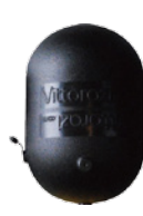
■ノイズボックス Moster/Fly ¥13,300 (税込 ¥14,630)