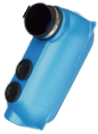
■ノイズボックス Solo/Raket ¥13,600 (税込 ¥14,960)