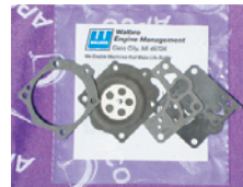
■ワルボロ WG 用 ¥2,200 (税込 ¥2,420)