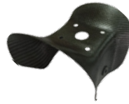
■エアーコンベアー ¥34,000 (税込 ¥37,400)