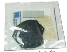
■ワルボロ WB32/37 メタルセット ¥2,500 (税込 ¥2,750)