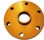
■プロペラスペーサー ¥4,200 (税込 ¥4,620)