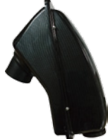
■ノイズボックス Solo/mini2 ¥15,000 (税込 ¥16,500)