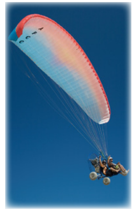
※ULはパトライク専用