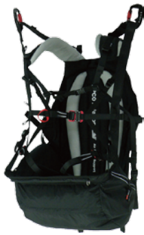
SLT PM 肩吊り + ¥2,000 (税込 ¥2,200) 腰吊り + ¥2,000 (税込 ¥2,200)

フライトに欠かせないハーネスは、APCO 社製軽量ハーネスの Split legs、SLT、2種類からご希望のハーネスを選択してください。