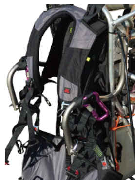
スイングバー(胸吊り)

フェザー標準の構成は、ハイフックポイント D-bar(肩吊り)仕様。オプションで2種類のスイングバーを使用したローフックポイント(胸吊り)仕様に変更可能。