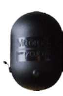
■ノイズボックス Moster/Fly ¥16,000 (税込 ¥17,600)