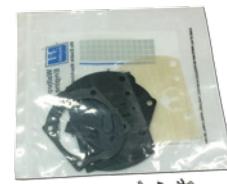
■ワルボロ WB32/37 メタルセット ¥2,500 (税込 ¥2,750)