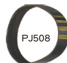
■mini2 リダクションベルト 9,600 (税込 ¥10,560)