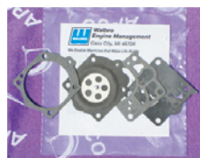
■ワルボロ WG 用 ¥2,200 (税込 ¥2,420)