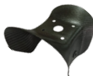
■エアーコンベアー ¥39,000 (税込 ¥42,900)