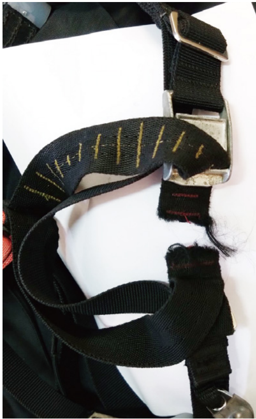
破断したトリムウェビング